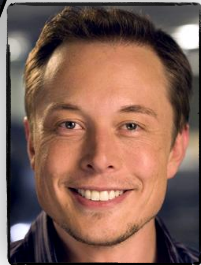
Business men and women