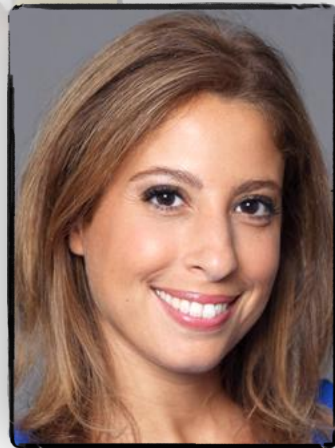
TV presenters Journalists