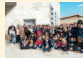
échange avec Sienne

L'EsaBac est ouvert à tous les élèves de l'académie. Le lycée Choiseul dispose d'un internat fille et garçon. La rénovation récente (2016) permet aux élèves d'y étudier et d'y vivre dans de bonnes conditions.