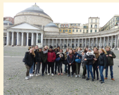
échange avec Meta di Sorrento

http://www.education.gouv.fr/cid52119/mene1004213a.html