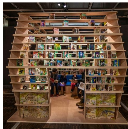
Exposition Cabanes –Cité des sciences