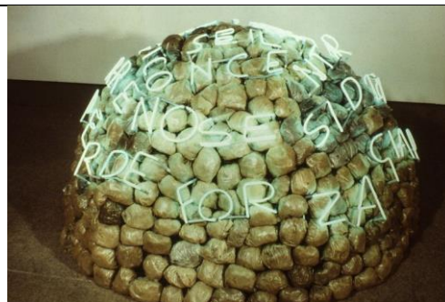
MERZ Mario (1925-2003), Igloo de Giap , 1968, armature de fer, sacs en plastique remplis de terres, tubes de néon,