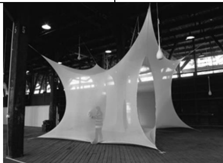
NETO Ernesto (né en 1964), Navedegna (détail de l'installation, vue de l'entrée), 1998, polystyrène et sable.