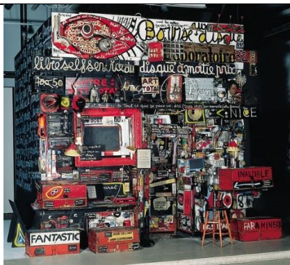
Ben Vautier – Le magasin de Ben XXème