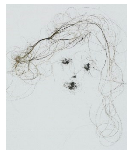
100 portraits , 2022, poussière des visiteurs de Chambord, 41 x 31 cm

Par ailleurs, le spectateur familier des œuvres de Lionel Sabatté retrouvera également ses « portraits de poussières », visages composés également à partir de la poussière toujours récoltée dans le monument. Il en proposera à Chambord une présentation monumentale, rassemblant 100 portraits sur une grande cimaise. Ailleurs, ce seront 5 loups de poussière, qui avaient fait sensation dans la galerie de l'Évolution du Museum d'histoire naturelle de Paris en 2011, qui habiteront un lieu que fréquentaient encore leurs modèles vivants à la Révolution !