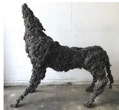
Loup de mai , 2022, poussières sur structure métallique, 144 x 146 x 46 cm

Par ailleurs, le spectateur familier des œuvres de Lionel Sabatté retrouvera également ses « portraits de poussières », visages composés également à partir de la poussière toujours récoltée dans le monument. Il en proposera à Chambord une présentation monumentale, rassemblant 100 portraits sur une grande cimaise. Ailleurs, ce seront 5 loups de poussière, qui avaient fait sensation dans la galerie de l'Évolution du Museum d'histoire naturelle de Paris en 2011, qui habiteront un lieu que fréquentaient encore leurs modèles vivants à la Révolution !